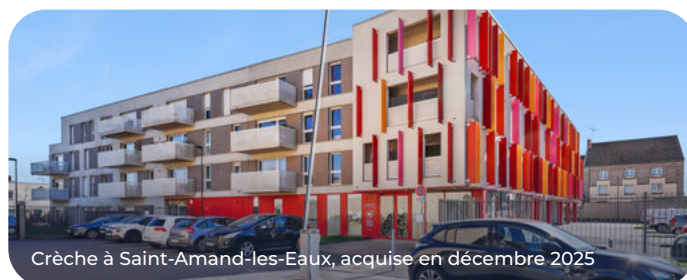
Crèche à Saint-Amand-les-Eaux, acquise en décembre 2025